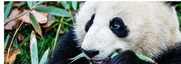
La hora de la Naturaleza

Portada Antecedentes Historia Recursos Días Internacionales