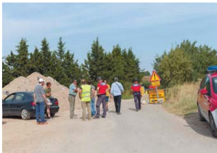
Acceso a la depuradora, con los carteles de obras. BLANCA ALDANONDO

muerte sin sentido", indicaba una de las parientes. El funeral se celebrará mañana domingo a mediodía en la iglesia de Nuestra Señora de la Asunción de Murchante.