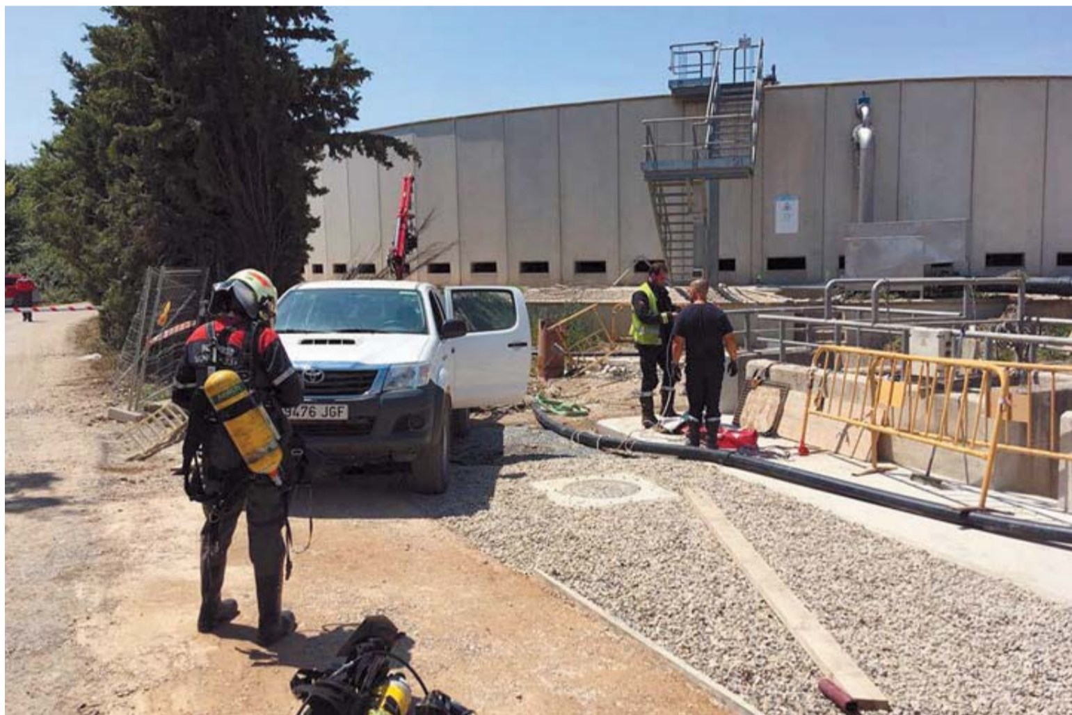
Bomberos y operarios, en las instalaciones de la depuradora, donde se produjo el accidente.