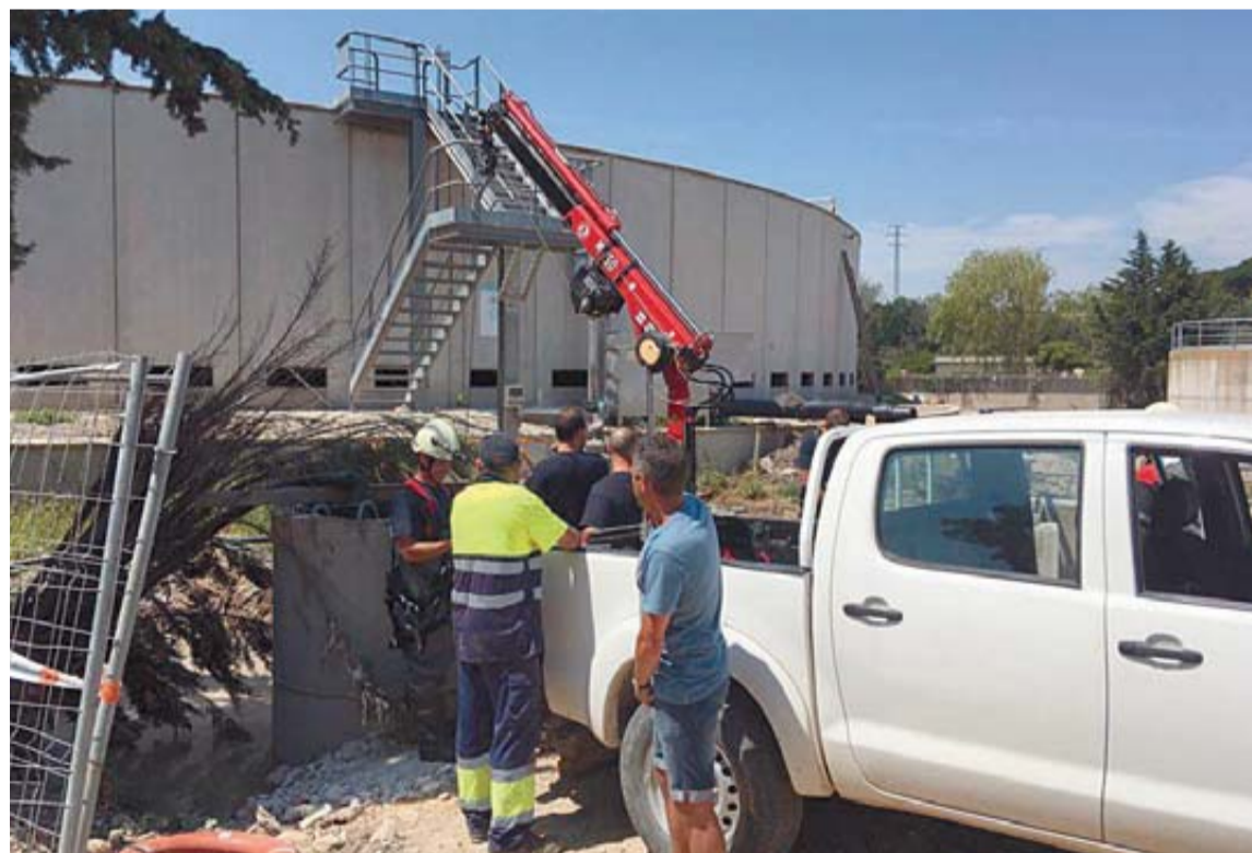
Bomberos y operarios, en las instalaciones de la depuradora, donde se produjo el accidente.

En sucesos similares, la persona fallece asfixiada debido a la concentración de gases tóxicos en el fondo del depósito. El oxígeno