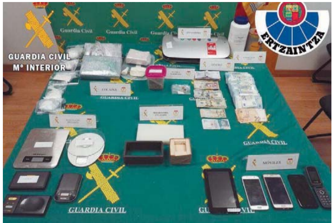
Droga, dinero y otros efectos intervenidos por la Guardia Civil en la operación.

la que procede su mujer. Aunque la pareja había residido durante algunos años en la capital aragonesa, desde hace aproximadamente tres, habían trasladado su residencia a esta localidad de la Ribera navarra.